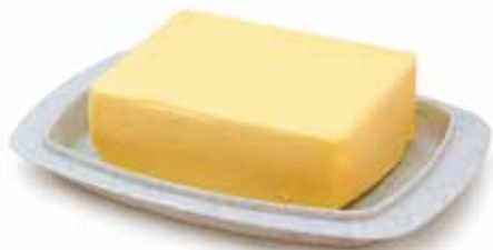
Tłuszcze (na przykład masło i margaryna) – w niewielkich ilościach