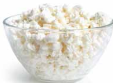
Ser kremowy, twarożek