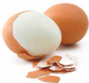
Jajka, w szczególności gotowane